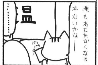
「温」本を読んで温まる3つ! 3階特設展示

ねこ次郎 買物しつめて 次の給瀬まで おかずはめずし 一本 ゆきち・ロシアス 侯爵家