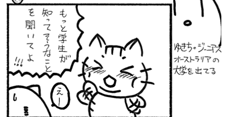
アタラの知らない都道府県のトセン3巻特設展示