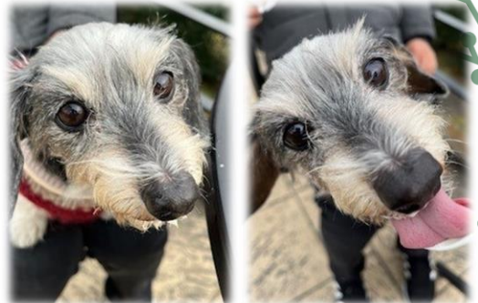
フローラさん(10歳) カニンヘンダックスフンド ワイヤーヘア カプチーノのあわあわが だいすき♡