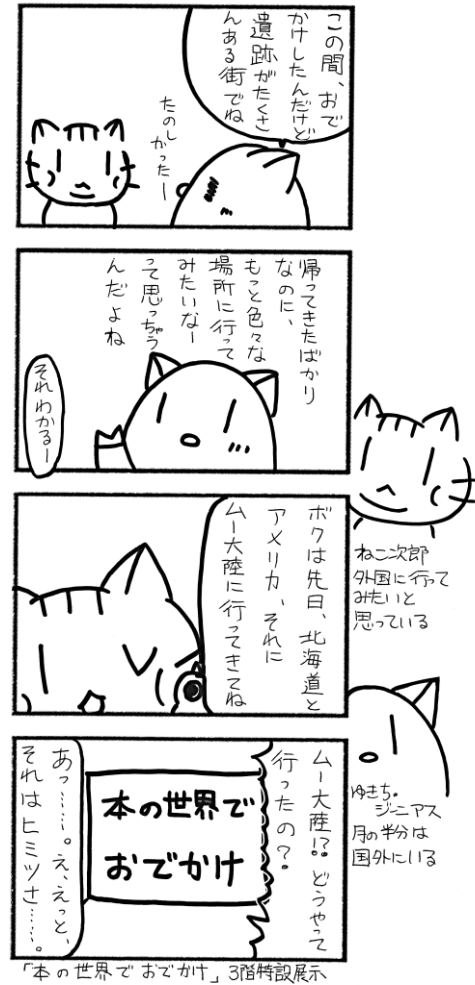
「本の世界でおでかけ」3階特設展示

また「八王子市全図」には「府立織染学校」や「府立染色研究所」等の施設が載っています(当時は東京府)。八王子は養蚕や織物が盛んだったことから「桑都」と称されていますが、これらの施設はいかにも桑都らしいと言えます。地図を見ると今も昔も変わらないものもあれば、もはやその形跡すら残っていないものもあることが一目でわかります。100年間の移り変わりをより身近に感じる事が出来るのではないのでしょうか。