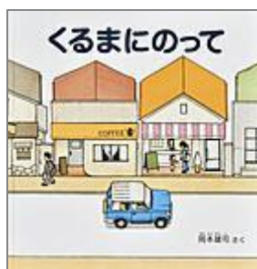
『くるまにのって』 岡本 雄司／さく 福音館書店